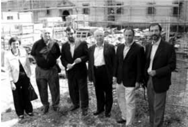
Un momento de la visita a las obras.